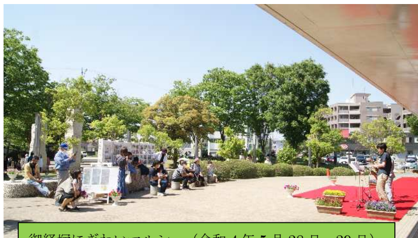
御経塚にぎわいマルシェ(令和4年5月28日、29日)