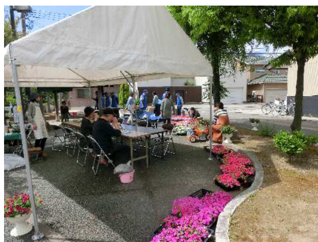
オープンカフェ（平成29年5月28日）