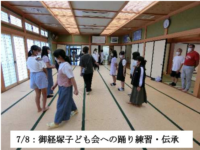
7/8: 御経塚子ども会への踊り練習・伝承