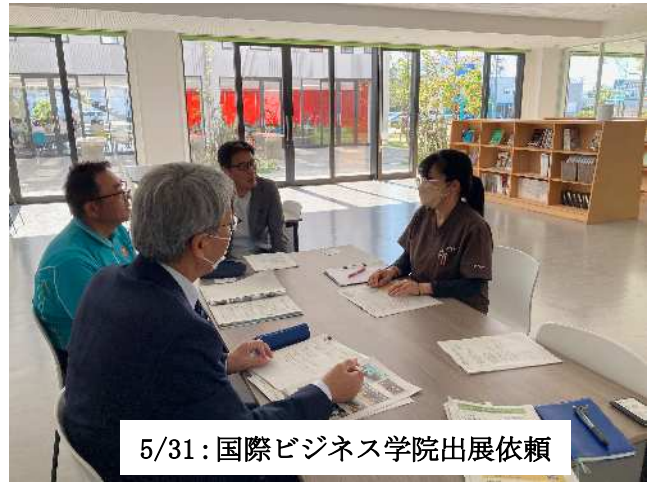
5/31: 国際ビジネス学院出展依頼