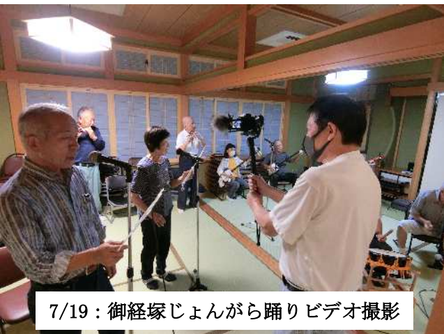
7/19: 御経塚じょんがら踊りビデオ撮影