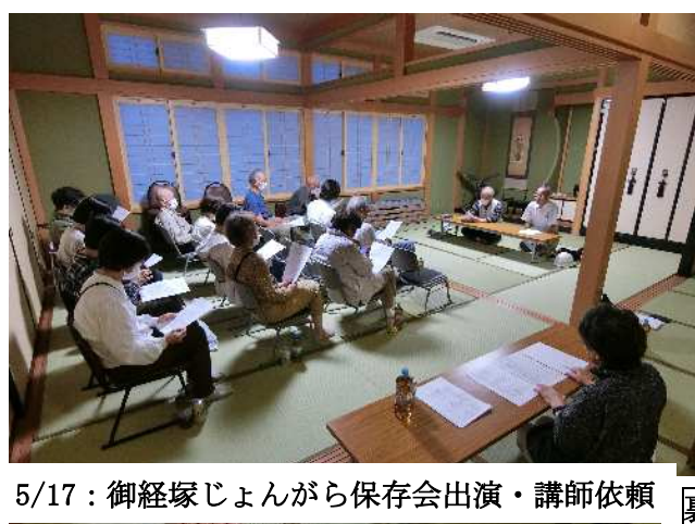
5/17：御経塚じょんがら保存会出演・講師依頼