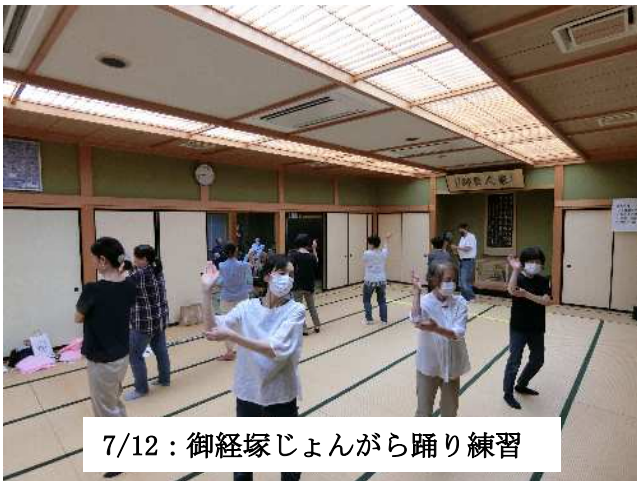
7/12: 御経塚じょんがら踊り練習