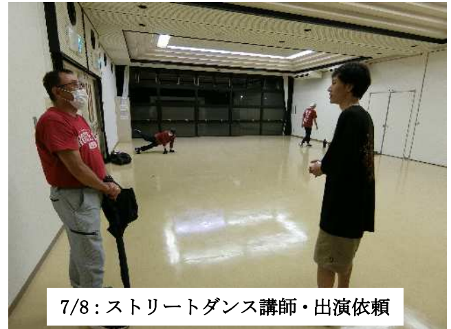
7/8: ストリートダンス講師・出演依頼