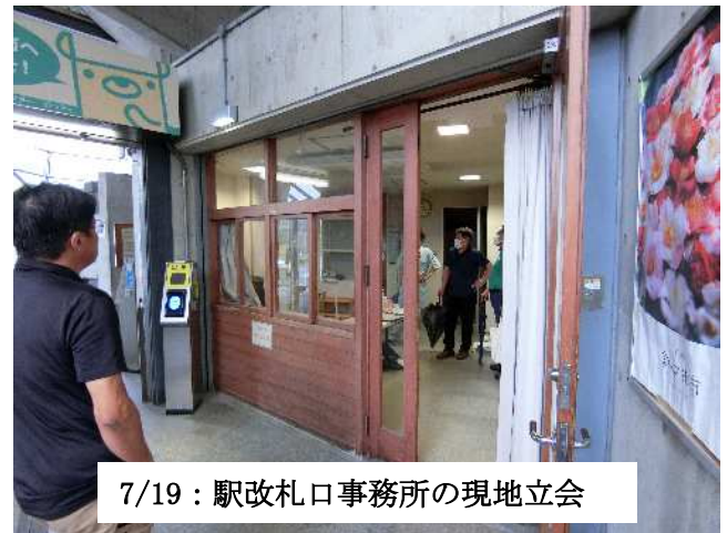
7/19: 駅改札口事務所の現地立会