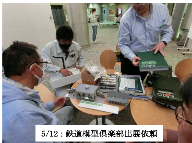
5/12：鉄道模型倶楽部出展依頼