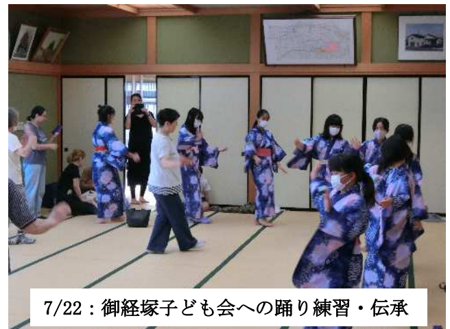
7/22: 御経塚子ども会への踊り練習・伝承