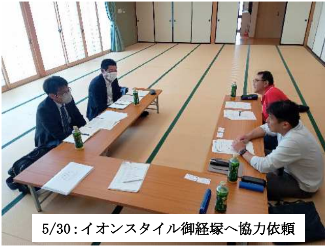
5/30: イオンスタイル御経塚へ協力依頼