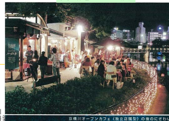
馬場川緑道イメージ (夜)