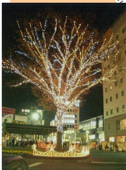
駅北広場夜の演出イメージ